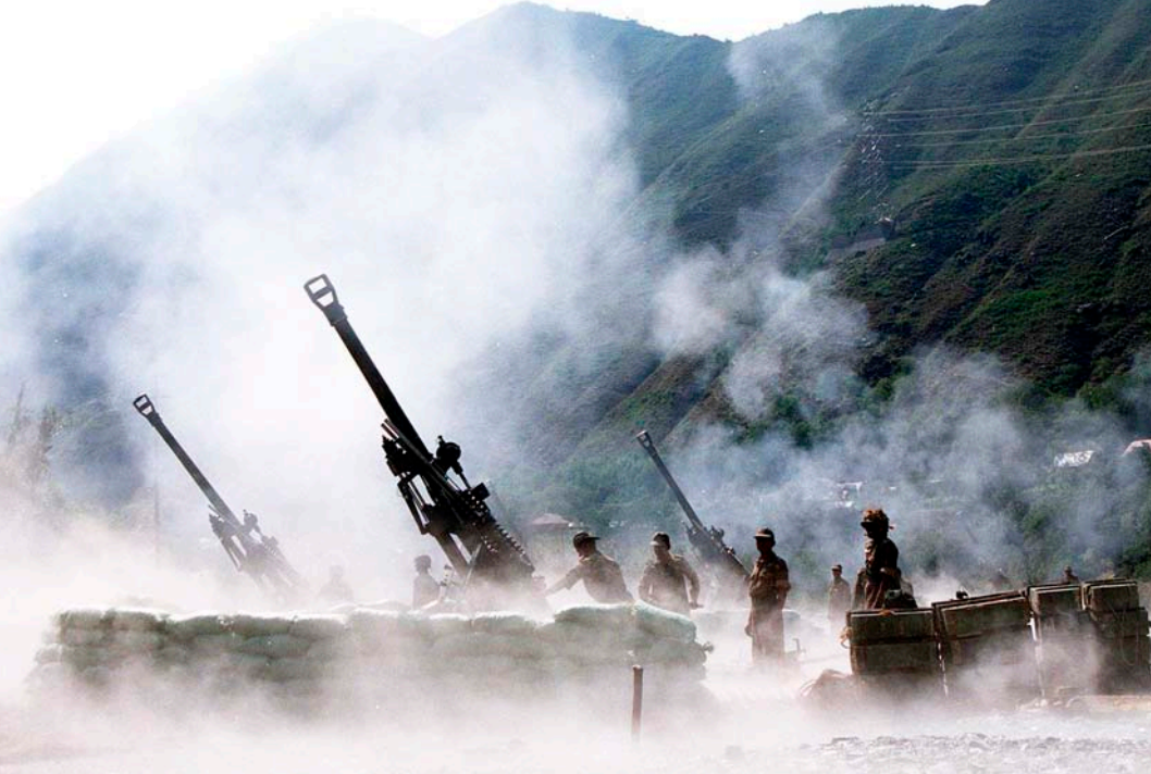
Indiska armén använde Boforstillverkade 155 mm kanoner i Kargilkriget i Kashmir 1999.