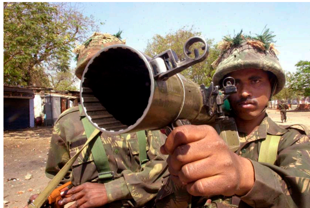
Indisk soldat med det svensktillverkade granatgeväret Carl Gustaf i samband med våldsamma oroligheter i Ahmadabad 2002.

Luftvärnsroboten Robot 70 finns idag i minst 18 länder, till exempel Argentina, Bahrain, Brasilien, Förenade Arabemiraten, Indonesien, Iran, Pakistan, Singapore och Tunisien. 1999 användes Robot 70 i »Kargilkriget« i Kashmir.