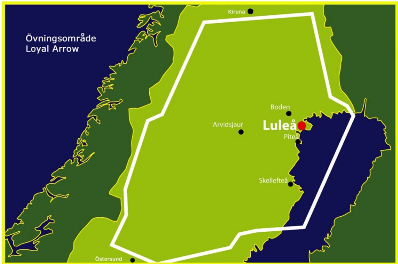
Karta från försvarets webbplats mil.se